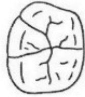
COLORI OCCLUSALI OCCLUSAL COLORS